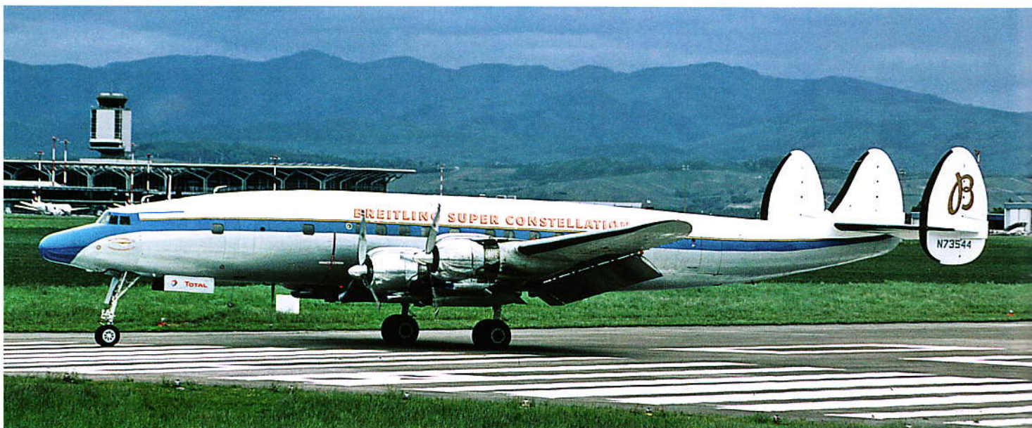
Die Super Constellation der »Super Constellation Flyers Association (SCFA)« nach der Landung in Basel.