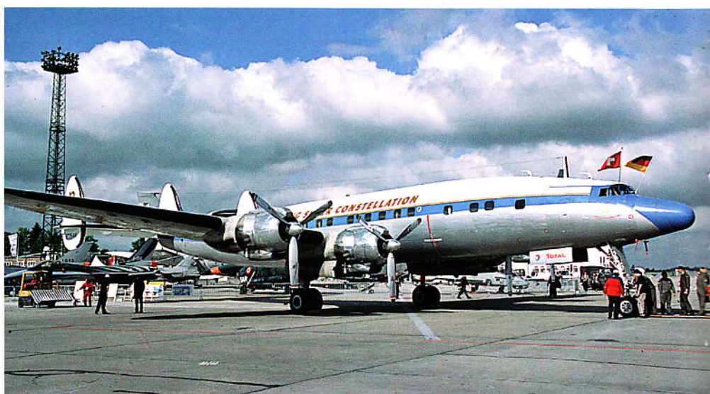
Auch auf der ILA in Berlin konnte man die Super Conny bewundern.